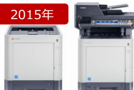
カラーA4複合機「ECOSYS M6535cidn」 カラーA4プリンター「ECOSYS P6130cdn」