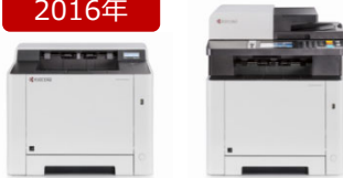
カラーA4複合機「ECOSYS M5526cdw」 カラーA4プリンター「ECOSYS P5026cdw」